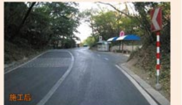
施工前后路面对比

时间：2010年9月 基本情况：道路老化严重，出现了严重龟裂、坑槽、松散等路病，部分路段平整度差，道路坡度不适，严重影响交通。 难点：景区道路不规则，多弯道，交通量大；树木葱郁，防火要求高。 处治：景区内，英达机组仅占据一股车道，其他车道均可正常通车，所有施工工序一气呵成，原本满是坑槽、裂缝的路面变得平整如新。而且施工中无噪音和扬尘产生，不会对景区造成任何污染。