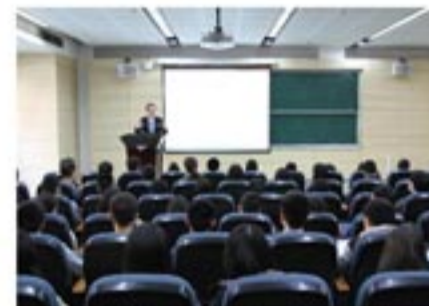
演讲中,施总分享了自己创新、创业的心路历程

“正如习大大所言——‘人民对美好生活的向往’,就是创新所求。”施总在演讲时谈到,英达一直将延长道路使用寿命、积极推进道路养护行业的循环经济发展作为企业的使命;企业创新必须具备3要素——深入的市场分析、严谨的逻辑推理及强烈的忧患意识。