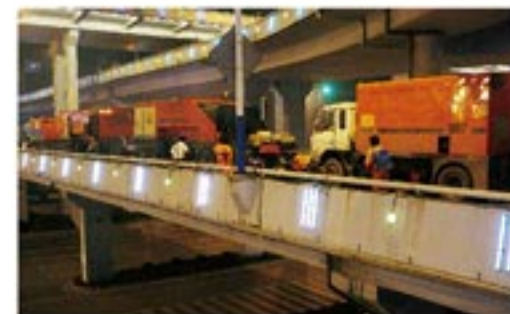
2009年9月,第11届全运会济南北外环养护