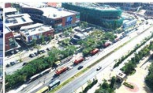
2016厦门国际马拉松配套赛起点道路修复