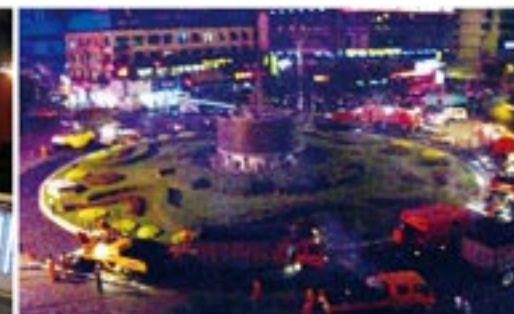
2011年至今,“中国-亚欧博览会”乌鲁木齐市近百条道路大中修