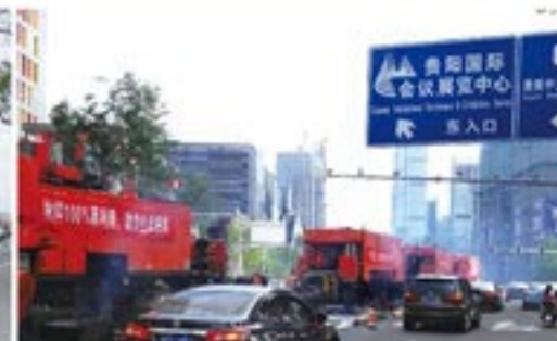
2015年5月,贵阳国际大数据产业博览会会场主干道整治