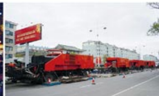
2012年9月,延吉建州60周年前夕道路治理