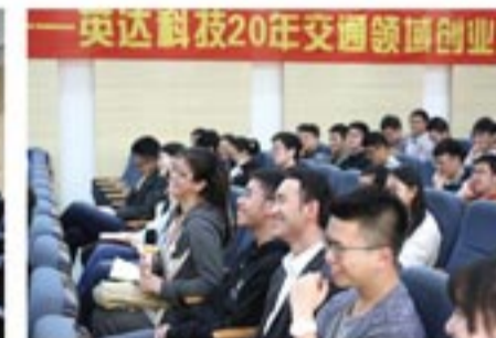
同学们在互动环节踊跃提问,施总睿智的回答激起阵阵笑声

“公路医生”英达自创立以来一直秉承着自主创新的发展理念,研制的就地热再生成套设备及技术被交通部鉴定为“国际领先”;截至目前,共获得近200项国家专利,是行业内拥有专利数量最多、科技成果转化最高的企业。