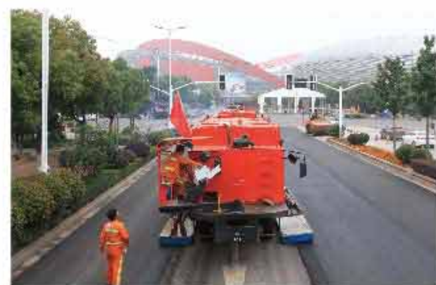
超快施工速度：英达上演“尖峰时刻”

据了解，英达主干道施工时单套机组日施工量约为1.5万㎡。在复杂的城市道路，也能拥有如此施工能力，令人叹为观止。