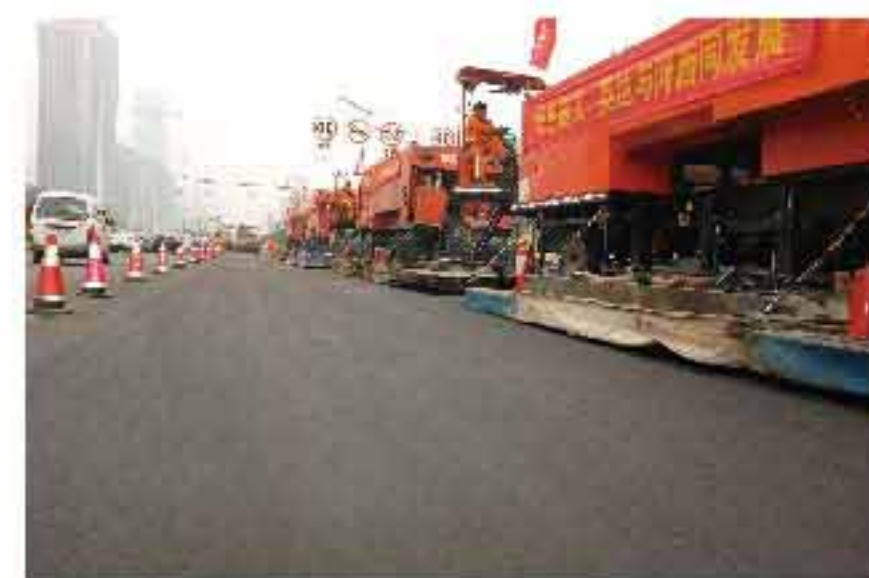
晨出晚归路不同，英达魔术“大变新路”

施工时不封路、施工后即可开放交通，在市民的不知不觉中完成道路修复，英达施工“润物无声”！