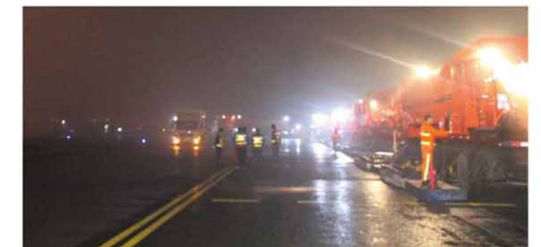
模块化设备组合是英达机场热再生施工的基础

黄花机场道面为SMA材料，不易加热。针对现状，英达调整机组的组合，在前端增加一台HM16加热设备，确保耙松前的道面加热充分；在耙松后增加一台HM18，确保集料前的混合料温度。对于添加抗车辙剂的工艺要求，英达临时对设备进行改装，在HM16设备上加装撒布系统。两个措施确保了工艺的实现与施工质量。