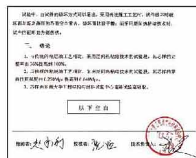
英达热粘结技术使路面层间抗剪强度较传统工艺大大提高 英达热再生施工后路面实现了骨料嵌挤