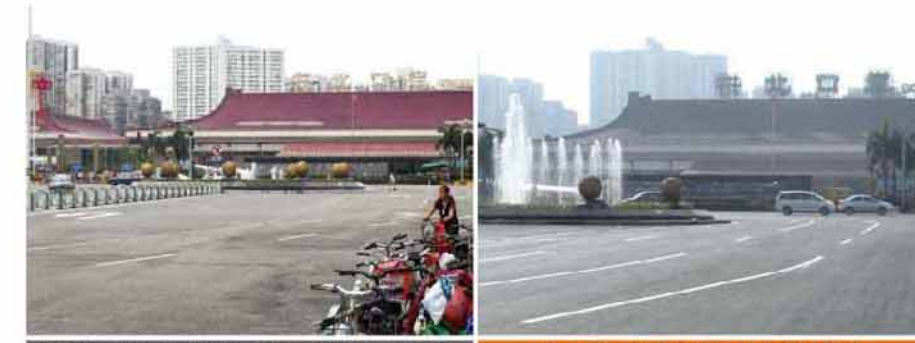
施工前，路面病害以裂缝、松散、麻面、变形等为主 施工后，各项指标均符合设计要求

广东省珠海市迎宾南路直通澳门拱北口岸，经过多年使用，主要病害包括裂缝、松散、麻面及轻微变形等，还有井盖周边破损、井盖下沉等问题。采用英达复拌加铺热再生工艺施工后，经检测各项指标均符合设计要求。