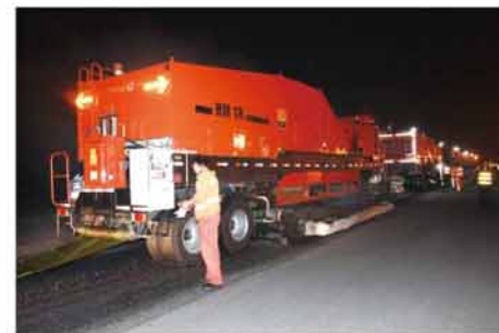
机场道面失稳、压密复合型车辙，英达“对症下药”选工艺

机场道面车辙兼具失稳型与压密型的复合特征，可适用公路沥青路面治理车辙的工艺。此前，英达已研发了多种专项治理车辙的工艺：针对一般车辙，采用普通整形工艺；针对深度车辙，采用复式再生工艺，并在波谷处添加级配偏粗的新沥青料；针对级配需调整路面，采用复拌再生工艺，等等。本次施工，应对黄花机场最深达3.5cm的车辙，英达选用复拌工艺，并添加准确计量的抗车辙剂。