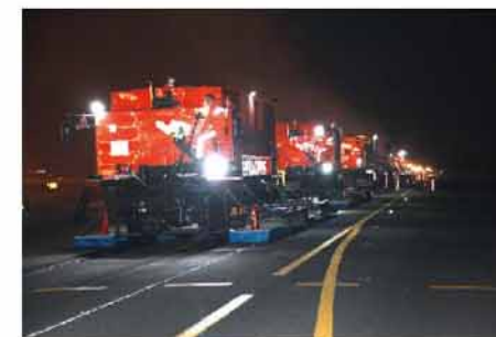
英达施工效率为传统工艺2倍以上

每天3小时的碎片施工时间，过去采用铣刨摊铺工艺时，为避免铣刨后不能摊铺影响跑道使用，施工面非常小。英达首先发挥设备的机动性，确保进、撤场在30分钟完成，不占用施工时间。在施工过程中，一体化的施工流程表现更佳。据测算，同样施工条件下，英达效率达传统工艺的2倍以上。