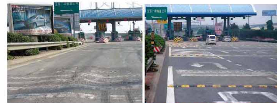
2006年3月施工前，车辙最深处达10cm 历经4个高温季节后（2009年7月），车辙未复发

江苏广靖锡澄高速某收费站前车辙严重，最深处超过10cm，采用英达整形就地热再生工艺进行治理，施工后检测路面渗水系数、平整度等各项指标均达优秀。三年后，车辙未出现复发迹象。