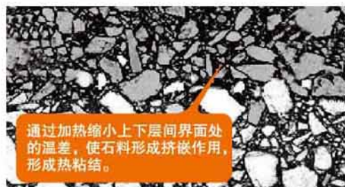
热粘结原理示意图

热粘结是通过提高上层沥青混合料摊铺前下层顶面温度，缩小上下层间界面处温度差（温度梯度）来提高层间粘结质量的一种施工技术。