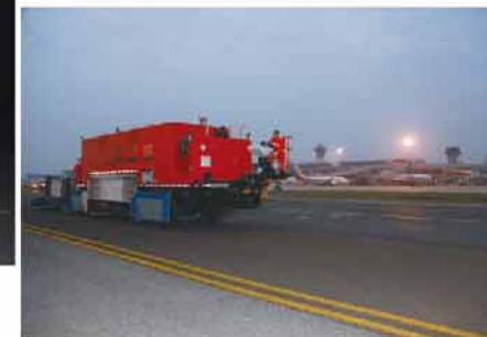
30分钟进、撤场，超强机动性保障效率