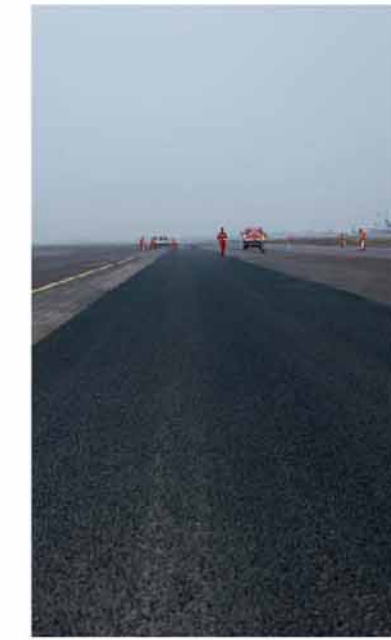
检测见证英达机场施工的优异质量

检测结果验证，对于机场道面养护这一亟待开发的新市场，英达就地热再生技术具有巨大优势。可见，本次黄花机场的施工更意义非凡。沿着这条飞天之路，英达热再生发掘的这一蓝海市场值得期待。