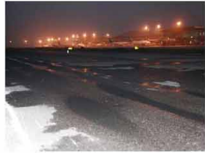
机场道面的严重车辙亟需新工艺治理

双重原因造成了机场道面的病害以重度车辙为主。传统铣刨施工后车辙很快复发，该如何解决？